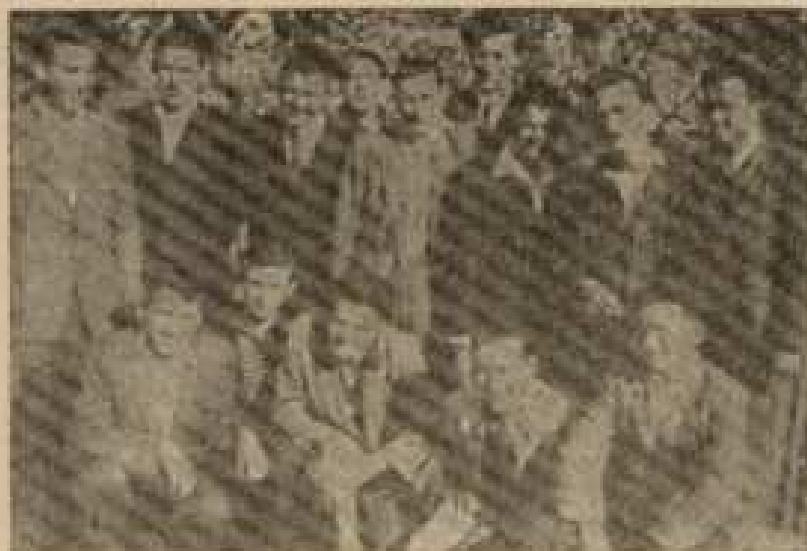
Výprava futbalistov Michalian v Soli.