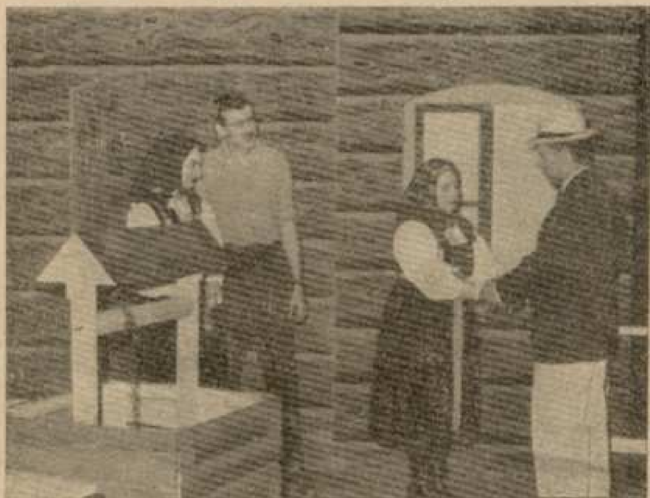
Futbalisti TJ Slovan Sariašské Michalany niekoľkokrát veľmi úspešne vystúpili aj na javisku. Na obrázku ich vidíme pri hre „Koliboci“.

o dorast nestaral a venoval všetku pozornosť mužstvu dospelých. V ročníku 1964–1965 budú obidve mužstvá štartovať v krajskej súťaži Východoslovenského kraja.