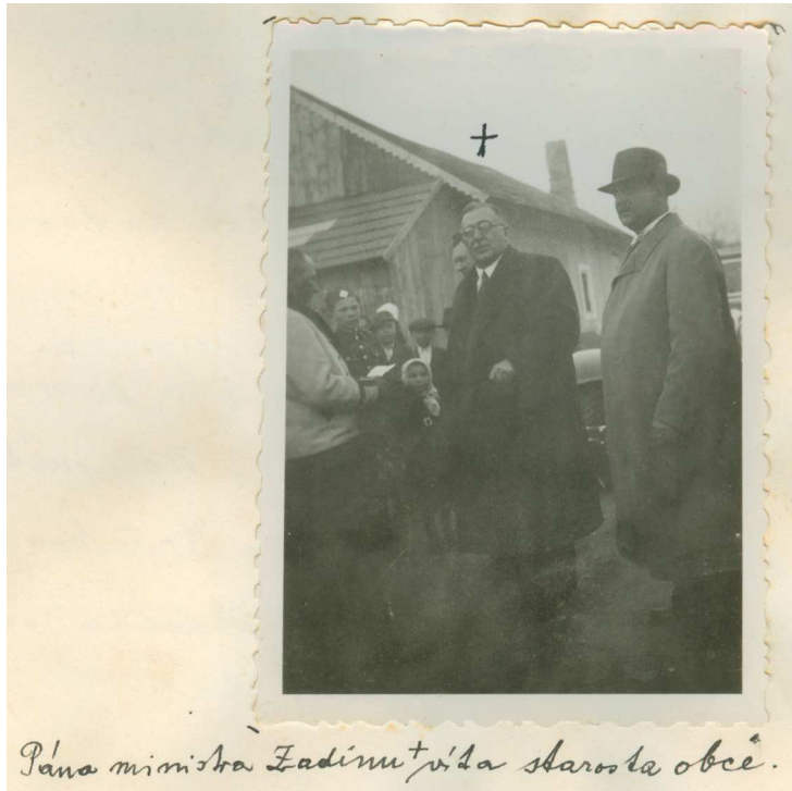
Pána ministra Zadinu + víta starosta obce.