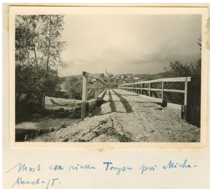
Most cez rieku Torysa pri Michalanoch n/T.

Podporu k stavbe poskytol štát v sume Ks. 70.000. Obce poskytly prívoz štrku k vyhotoveniu násypu.