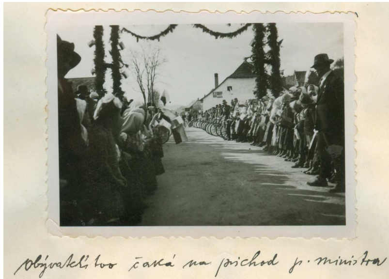
Obyvateľstvo čaká na prichod p. ministra

Pána ministra Zadinu + víta starosta obce.