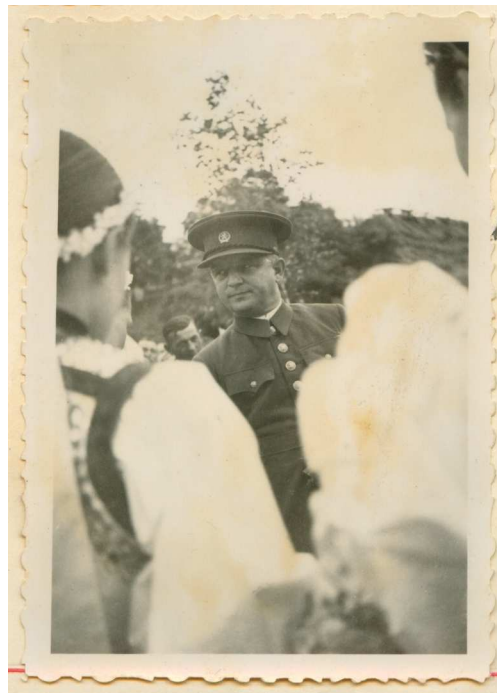
Dievčatá podávajú chleba a soľi p. ministrovi.