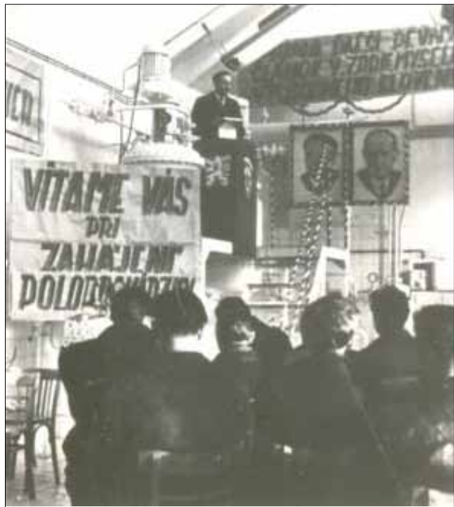
Fotografia zo zahájenia výroby

V tomto roku si Imuna Pharm, akciová spoločnosť, Šarišské Michaľany pripomína dve jubileá: 60 rokov od započatia výstavby a 1. februára 55. výročie od zahájenia výroby. Návraty do minulosti majú vždy svoju osobitú prítlačivosť. Preto pripomeňme si v krátkej retrospektíve bohatú históriu podniku.