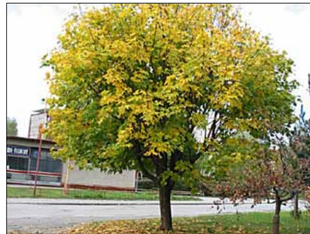
Takto vyzeral strom pred vypuknutím STIHL-epidémie.