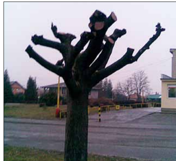
... a takto vyzera teraz