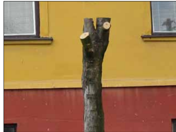
Strih stromov v štýle „Michalany 2002/2011“.

Strom v obytnej zóne plní dôležitú funkciu – produkuje kyslík, dáva tieň, tlmí hluk, zachytáva prach, znižuje teplotu okolia. Preto rozumný človek stromy chráni.